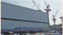
工事中の博多駅(現在)