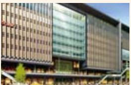
新博多駅ビル予想図(2011年開業予定)